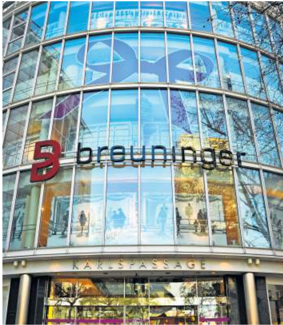
Dem Stuttgarter Kaufhaus stehen wieder unruhige Zeiten bevor.