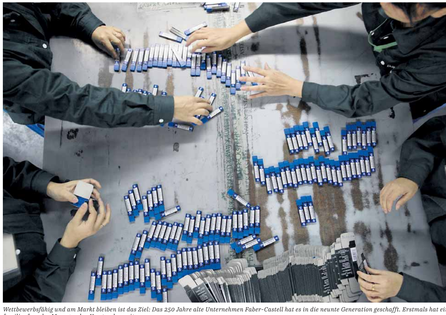
Wettbewerbsfähig und am Markt bleiben ist das Ziel: Das 250 Jahre alte Unternehmen Faber-Castell hat es in die neunte Generation geschafft. Erstmals hat ein familienfremder Manager den Vorstandsvorsitz.